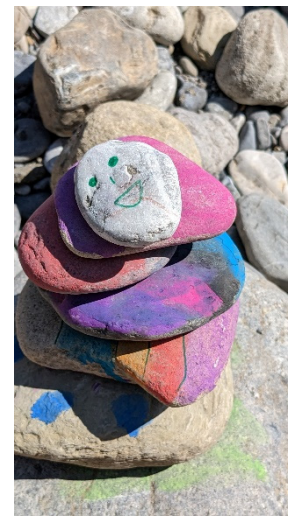
Der Campingplatz in Doren bot viele Möglichkeiten für Erlebnisse