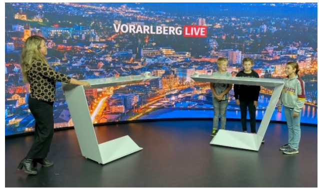
Das Medienhaus in all seiner Vielfalt mit Print und digitalen Anwendungen beeindruckte die Kinder.