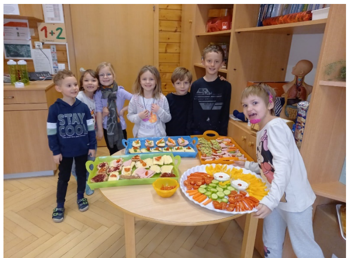
Gesunde Ernährung in praktischer Form kennenlernen, das ermöglichte der Elternverein in mehreren Aktionen.

Vielen Dank dem Elternverein und vor allem den freiwilligen Helferinnen für das Organisieren der gesunden Jause!