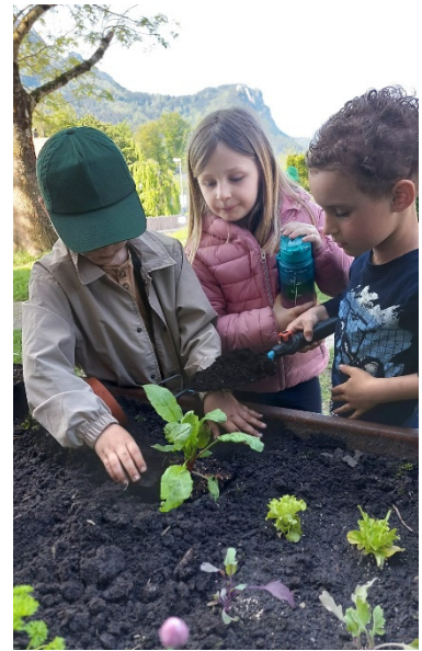
Das Hochbeet vermittelt einen Bezug zur Natur.

Vielen Dank an den Elternverein für die Finanzierung der Setzlinge.