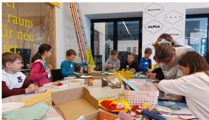
Im Campus Dornbirn konnten die Kinder Erfahrungen mit diversen digitalen Anwendungen sammeln.

In Teams experimentierten sie, probierten Neues aus, lösten Probleme, programmierten Roboter, knackten Codes und bastelten eigene Roboter. Es waren sehr spannende und interessante Tage für die Schülerinnen und Schüler sowie deren Lehrpersonen.