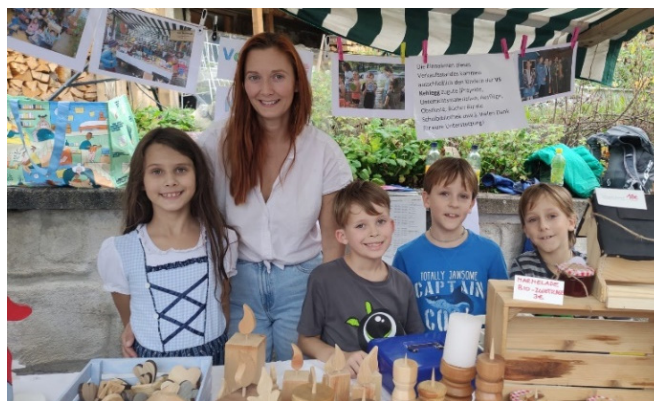
Auch Eltern halfen, die Marktstände zu betreuen. Der gesamte Erlös ging an den Elternverein.

Bei Sonnenschein und milden Temperaturen fand am Sonntag, 23. Oktober 2022 der Kehlegger Dorfmarkt statt. Die Schülerinnen und Schüler bastelten und werkten seit Schulbeginn, um schöne und nützliche Produkte für ihren eigenen Marktstand herzustellen: Vogelhäuschen, Lavendelbadesalz, Apfelgirlanden, Weihnachtskarten, Windlichter, Lavendelduftsäckchen und vieles mehr.