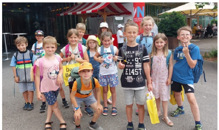
Buch am Bach: ein schöner Ausflug am Schuljahresende